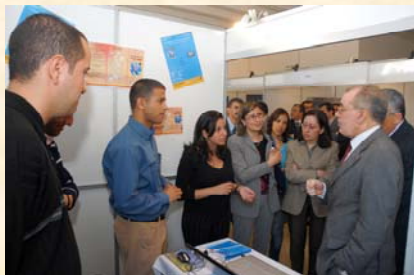
Les primés exposent à la journée Mondiale des télécoms 17 Mai 2008

Cette manifestation vise à étudier les opportunités de création des projets et à exploiter au mieux les mesures et les encouragements initiés par l'Etat pour promouvoir la création des entreprises et impulser l'intégration des jeunes dans le circuit économique outre l'encouragement de l'esprit d'initiative et d'innovation chez les jeunes pour relever les défis de l'avenir.